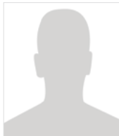
Kotka p. 010 289 6952