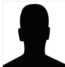
Kotka p. 010 289 6952