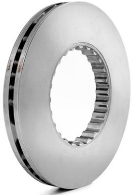
Volvon patentoitu tuuletettu jarrulevy

vanadiinia ja molybdeenia, jotka lisäävät kulumisen ja halkeamisen kestoa. Jarrulevymateriaali yhdistettynä Volvon alkuperäiseen jarrupalamateriaaliin takaa pidemmän käyttöiän, vähentää melua ja varmistaa parhaan jarrutustehon. Tämä parantaa turvallisuutta ja pienentää käyttökustannuksia.